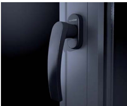
Novonic ručka prozora sa skrivenim pogonskim mehanizmom Novonic Fenstergriff mit verdeckt liegendem Getriebe

Schüco Novonic bietet gutes Design: Die Softline-Kontour Schüco Novonic 60 SL, das exklusive Profildesign für Luxuswohnbauten. Der attraktive Handgriff bietet durch das versenkbar eingebaute Getriebe ein gutes und sehr ergonomisches Design.