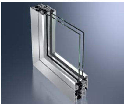
Schüco prozori Novonic 60 SL Schüco Fenster Novonic 60 SL

Schüco Novonic nudi dobar dizajn: Softline-izgled Schüco Novonic 60 SL, ekskluzivni dizajn profila za luksuzne stambene zgrade. Atraktivna ručka s upuštenim ugrađenim pogonom ima ergonomski dizajn.